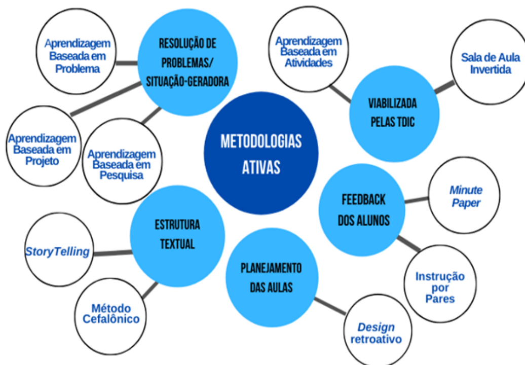
Figura 1 - Abordagens de Metodologias Ativas