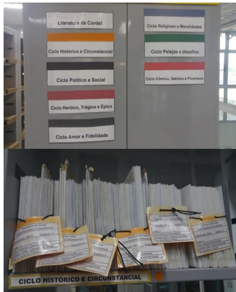
Imagem 1 - Sinalização nas estantes na BCZM