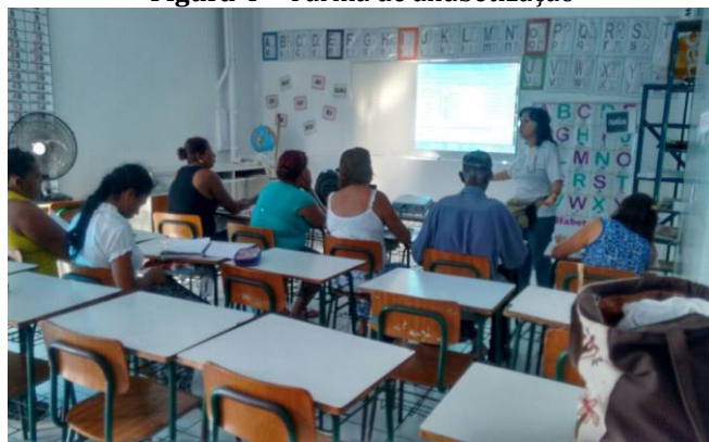
Figura 4 – Turma de alfabetização