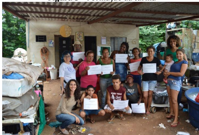
Figura 5 – Formação da turma

conhecimento. É por meio do diálogo que o educador cria as possibilidades para estabelecimento de confiança e respeito mútuo.