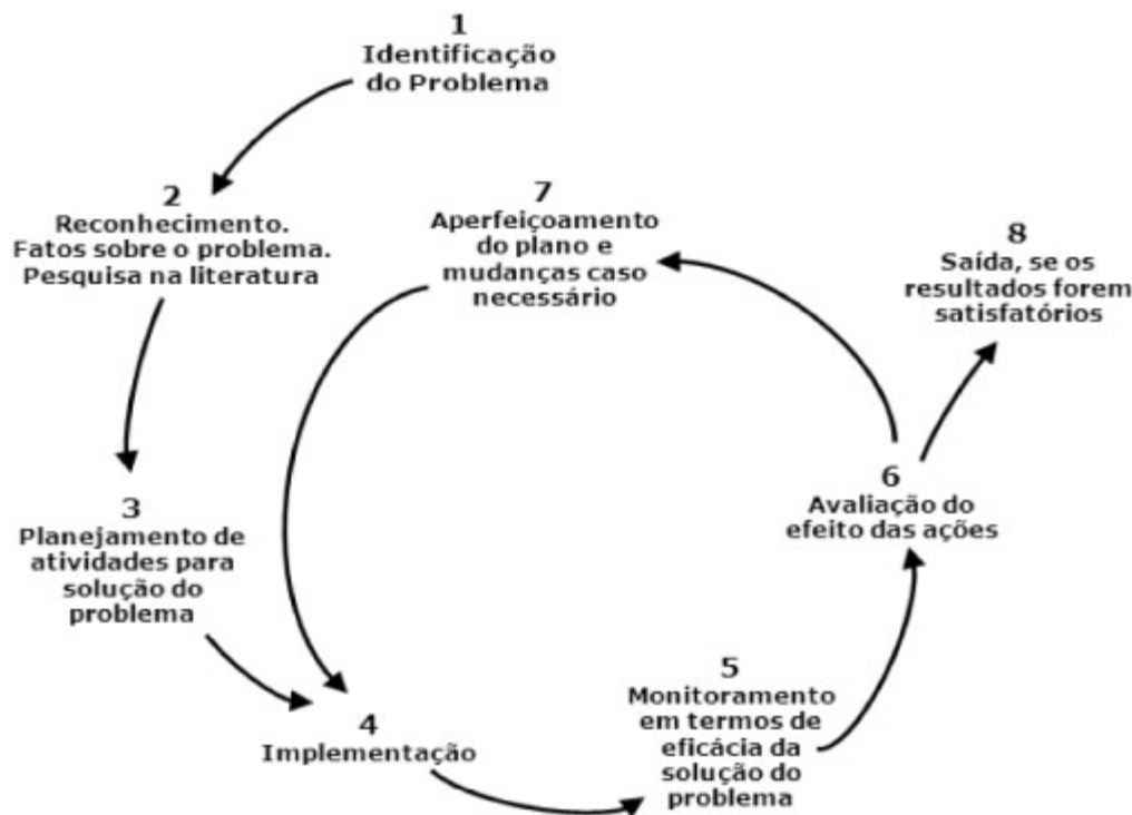
Figura 1 - Esquema da pesquisa ação de McKay e Marshall