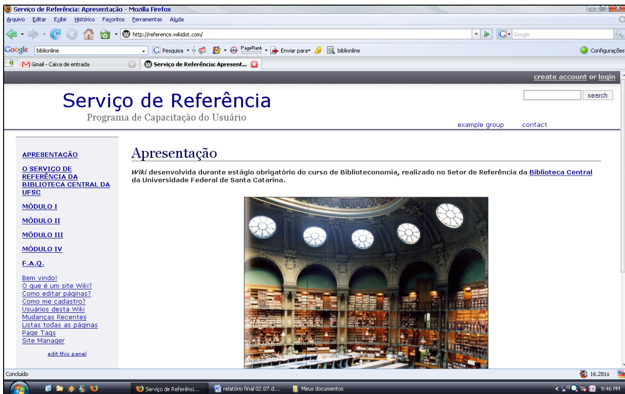
a 2 – Layout da wiki .

A wiki desenvolvida pode ser acessada de qualquer computador através da página http://www.reference.wikidot.com . A figura abaixo, retrata a página inicial da wiki .